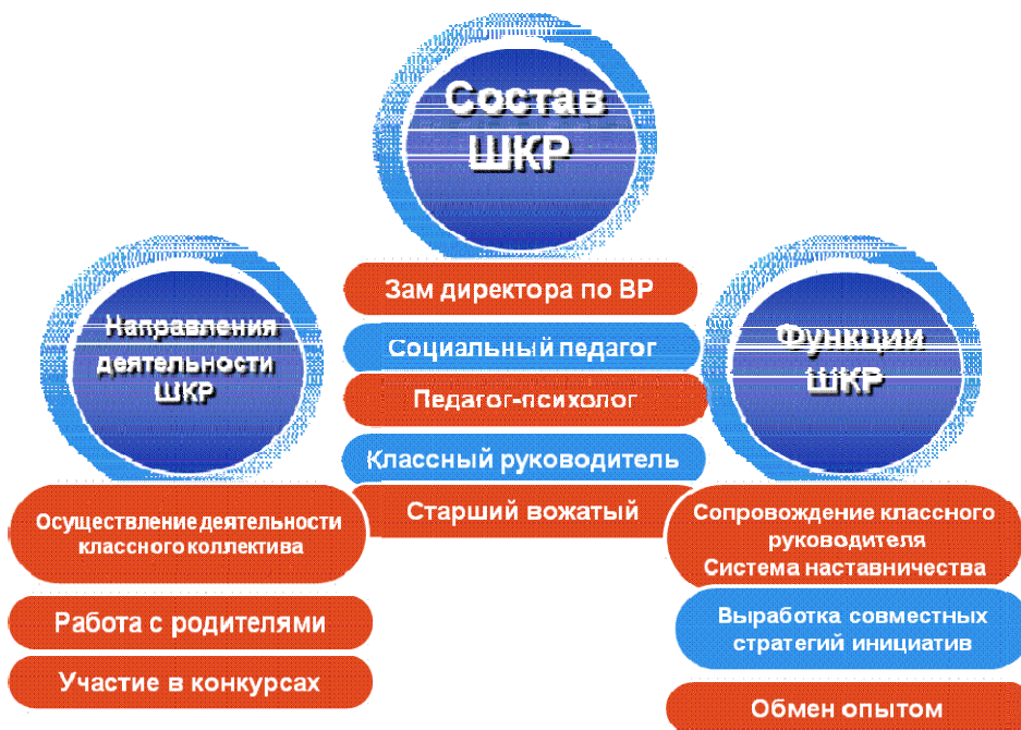
Рисунок 1. Состав, направления, функции школы классного руководства