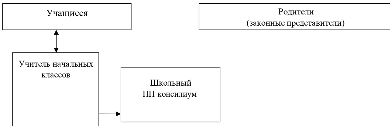
Рисунок 1. Модель взаимодействия педагогов и специалистов

Особое место в модели взаимодействия педагогов и специалистов общеобразовательного учреждения занимают родители (законные представители) учащихся с умственной отсталостью (интеллектуальными нарушениями) в решении вопросов их развития, социализации, здоровьесбережения, социальной адаптации и интеграции в общество.